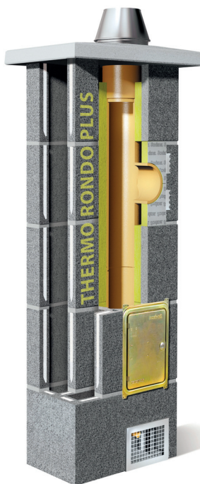
System kominowy Schiedel Thermo Rondo Plus