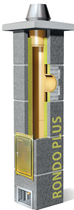
System kominowy Rondo Plus